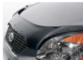
Déflecteur de capot