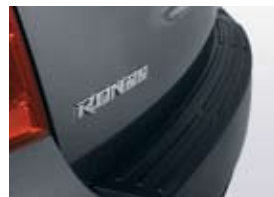
Protecteur pare-chocs arrière