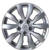
Jantes en alliage de 16 po