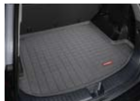
Protection d'espace de chargement