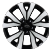
Jantes en alliage de 17 po