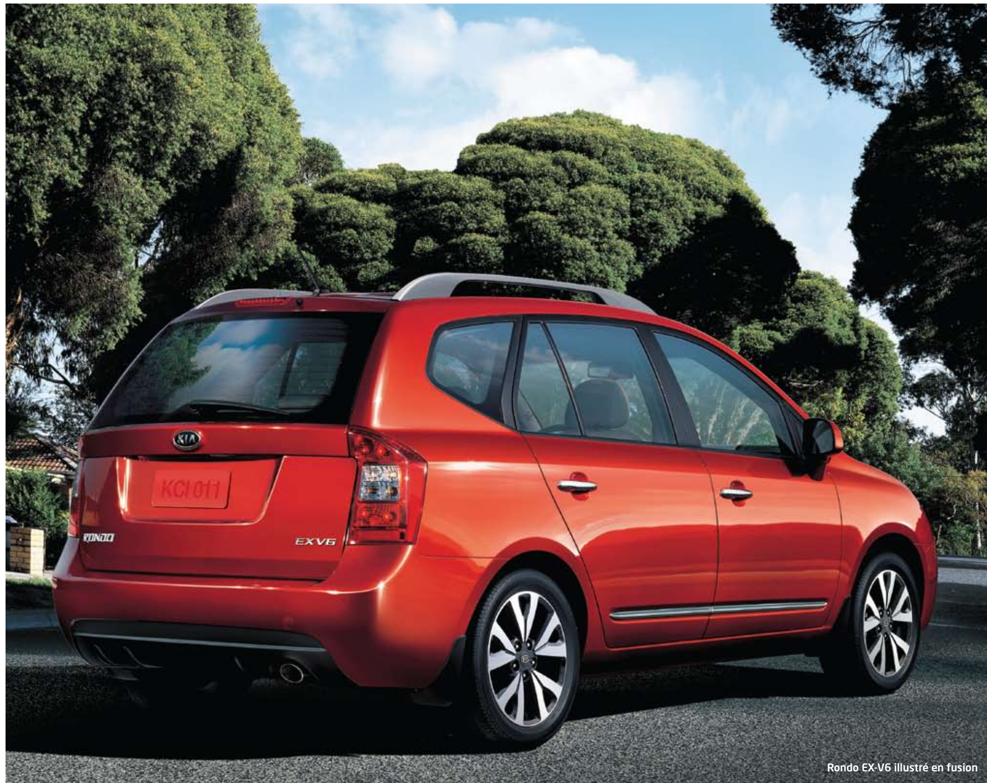
Rondo EX-V6 illustré en fusion