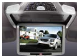
Lecteur de DVD de 10 pouces