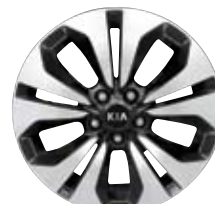
Jantes sport en alliage usiné de 18 po