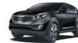
Cerise noire (N) TN/CN/O

TN = Tissu noir acier, CN = Cuir noir acier, O = Intérieur orange M = Peinture métallisée, N = Peinture nacré.