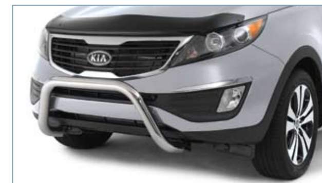
Défecteur de capot, calandre et pare-broussailles

Les pièces et accessoires de marque Kia sont conçus par Kia et installés par des professionnels chez votre concessionnaire Kia. Pour obtenir davantage de renseignements sur la gamme complète des Pièces et accessoires de marque Kia, rendez-vous chez votre concessionnaire Kia, visitez www.kia.ca ou appelez le 1-877-542-2886