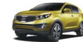
Jaune électronique TN/CN