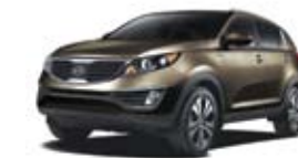
Sable (M) TN/CN