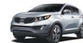
Argent brillant (M) TN/CN