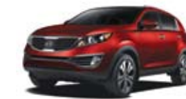
Rouge lumière (M) TN/CN/O