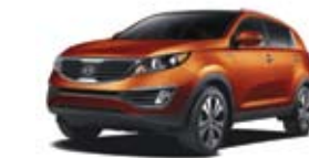
Orange techno (M) TN/CN/O