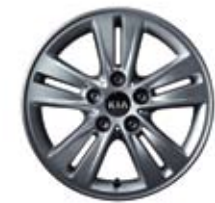
Jantes en alliage de 16 po