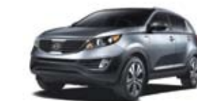
Argent minéral (M) TN/CN