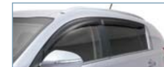
Visières latérales sport