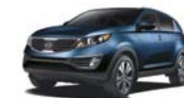
Bleu d'anta (M) TN/CN/O