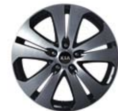
Jantes en alliage usiné de 18 po