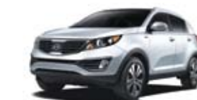
Blanc limpide TN/CN/O